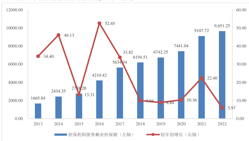
图表 3. 担保机构债券剩余担保额及增速（单位：亿元，%）

根据 Wind 统计，2022 年末，担保机构债券剩余担保额为 9651.25 亿元 2 ，较上年末增长 5.97%，增速同比放缓。2020-2022 年末，承担债券担保责任的担保机构数量分别为 55 家、54 家和 55 家，从事债券担保业务的机构数量在经历连续几年的下降后，2019 年以来有所回升。